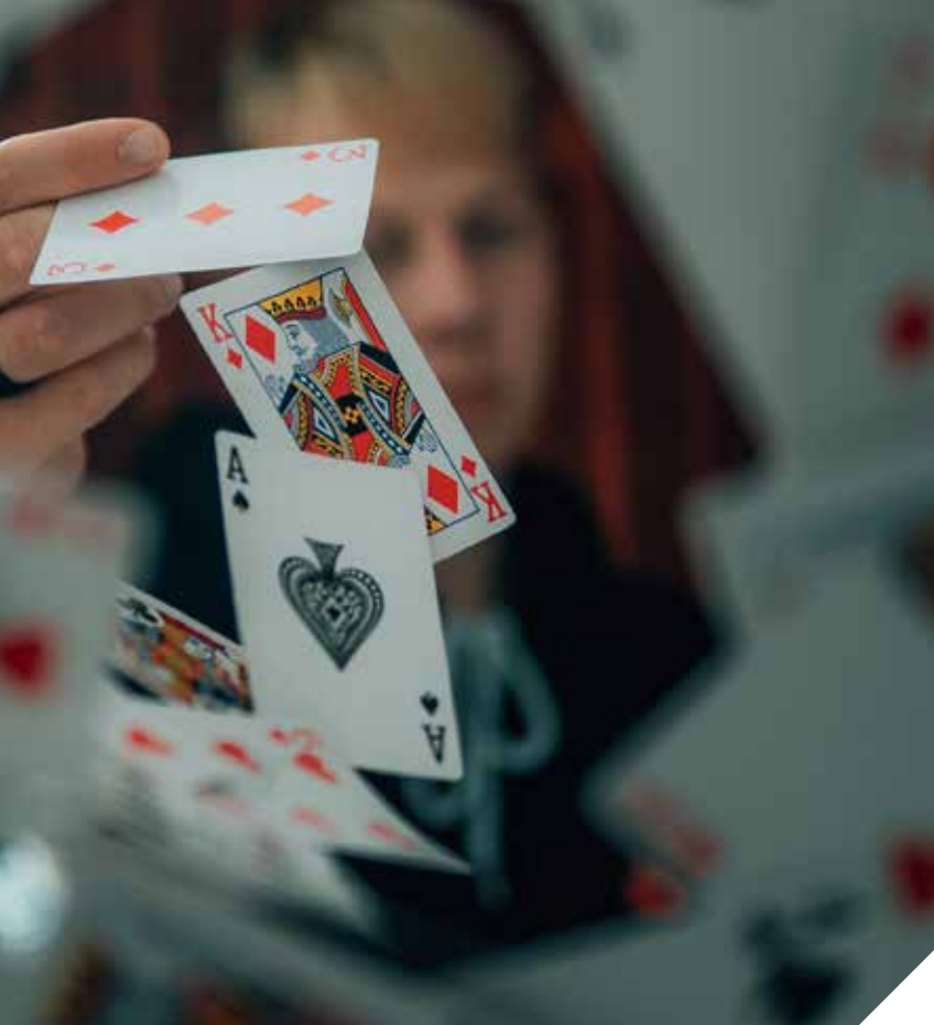
Minderjarige jongeren komen gemakkelijk online casino's binnen