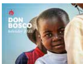
Don Bosco kalender 2023 Prijs: € 5 (excl. verzendkosten)