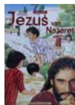
Jezus van Nazaret Prijs: € 10 (excl. verzendkosten)