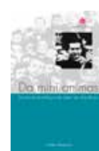
Da mihi animas Prijs: € 15 (excl. verzendkosten)