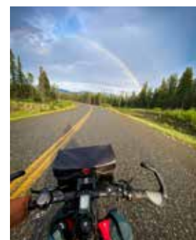
Als grote fan van de film 'Into The Wild' kon een bezoek aan de befaamde Magic Bus niet ontbreken