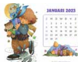
Wenskaartkalender 2023 Prijs: € 6 (excl. verzendkosten)