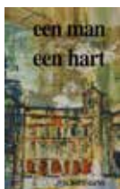
Een man met een hart Prijs: € 5 (excl. verzendkosten)