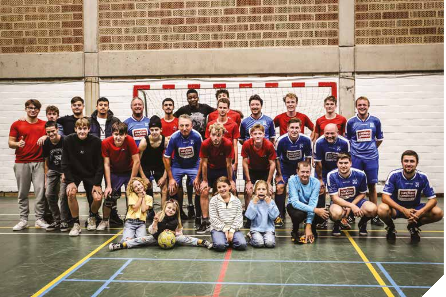
Iedere dinsdagavond neemt het leerkrachtenteam van Don Bosco Halle het op tegen een ploeg van leerlingen.