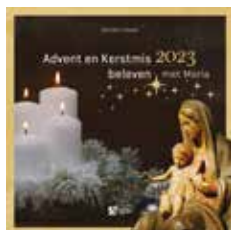
Wegen naar Kerstmis 2023 Prijs: € 6 (excl. verzendkosten)