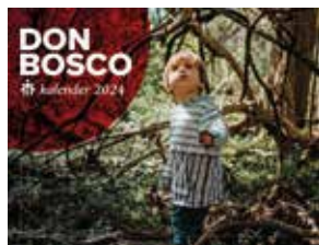
Don Bosco kalender 2024 Prijs: € 5 (excl. verzendkosten)