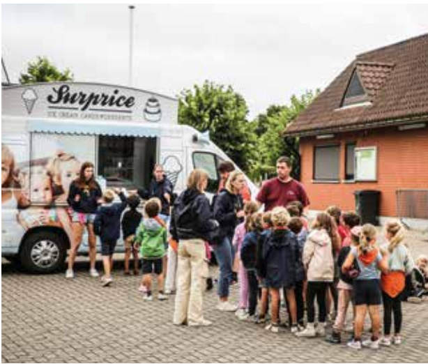
Speelplein Kinderland won dit jaar het bezoek van een ijskar.