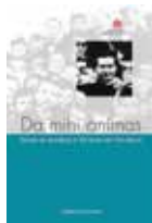
Da mihi animas Prijs: € 15 (excl. verzendkosten)