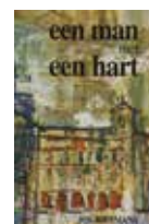
Een man met een hart Prijs: € 5 (excl. verzendkosten)