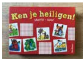
Memospel: ken je heiligen! Prijs: € 12,50 (excl. verzendkosten)