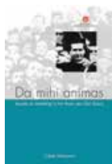
Da mihi animas Prijs: € 15 (excl. verzendkosten)