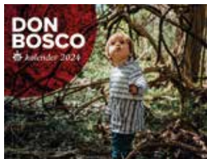
Don Bosco kalender 2024 Prijs: € 5 (excl. verzendkosten)