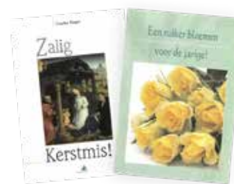
Duopakket: 'Zalig Kerstmis' en 'Een ruiker bloemen voor de jarige' Prijs: € 5 (excl. verzendkosten)