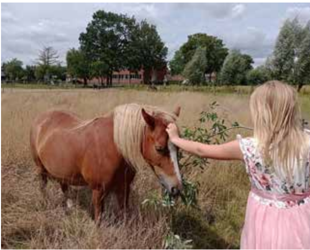
Het schoolondersteunend project De Stormkering biedt onder meer hippotherapie aan.