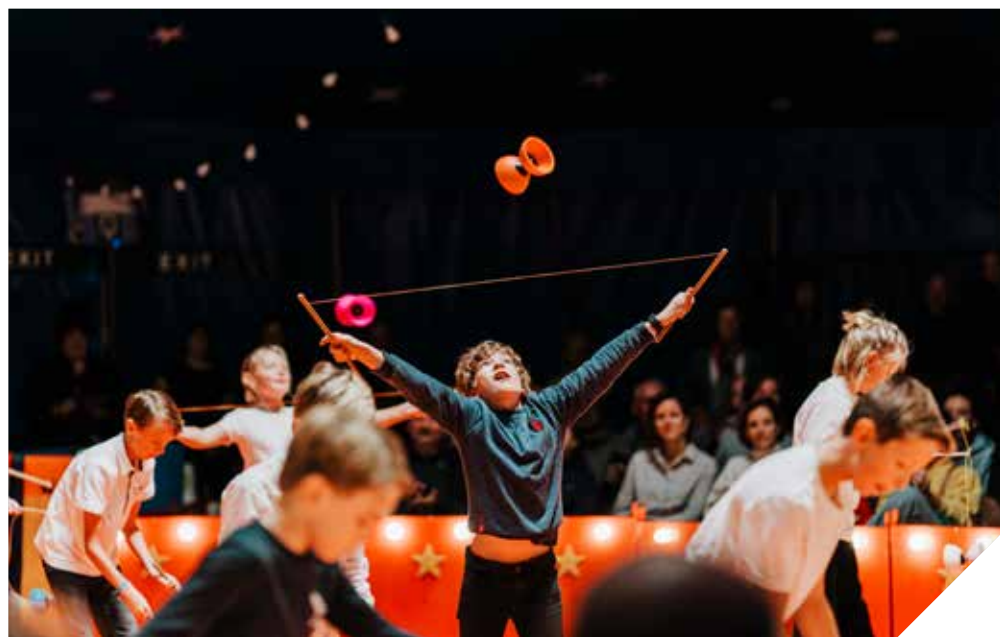
Circus Picolini werkt al 25 jaar samen met scholen: "Het is anders, maar het concept slaat aan."

► “Je hebt de kleuters die hun kunstjes tonen, de oudere leerlingen die hun nieuwe talenten laten zien, een special act van de leerkrachten en tussendoor zijn er ook spectaculaire acts van onze dochters of onszelf. Alles wisselt mooi af zodat de toeschouwers een heus spektakel te zien krijgen.”